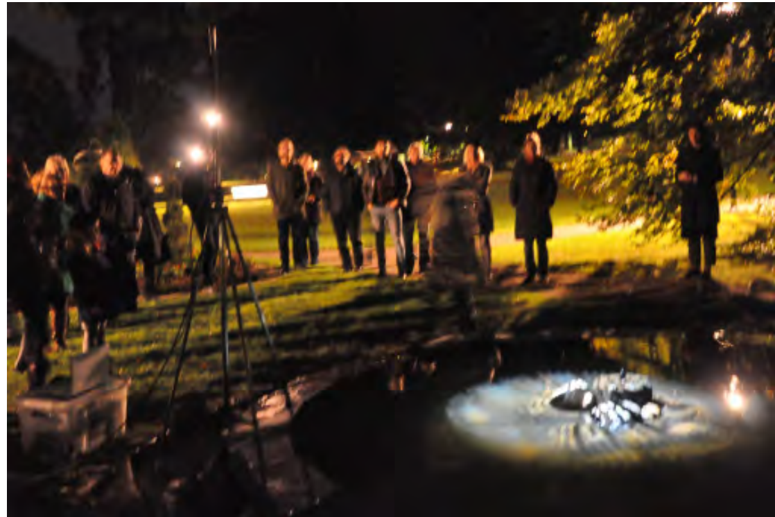
Plats: Theleborgs slottspark, Växjö